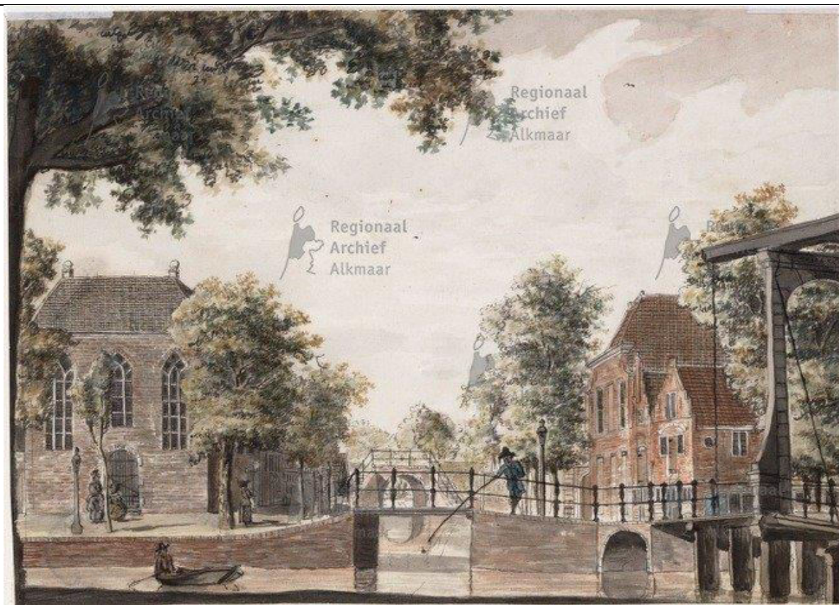
Gezien vanaf de Oudegracht: (1790) Links de Lutherse kerk Rechts de RK Banenkerk.