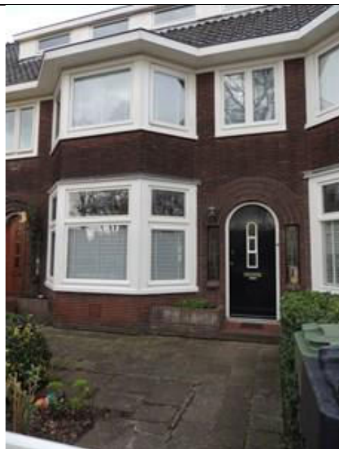
2 stenen Mozes en Rebekka de Jong-Blok