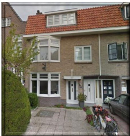
2 stenen Levi Elzas en dochter Bloemetje