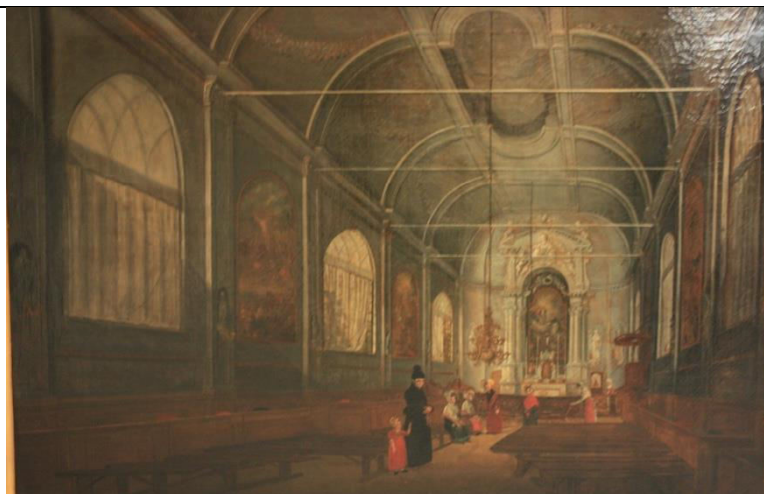
Interieur Banenkerk. (schilderij Horstok)

Een zware tijd begon er voor de katholieken toen zij vanaf de 17de eeuw gedwongen werden ondergronds te gaan en hun geloof moesten belijden in schuilkerken. Toen het katholieke geloof vanaf 1795 gedoogd werd waren er in de 18de en eerste helft 19de eeuw